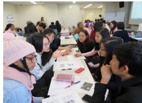
2019.01 Harvard Session