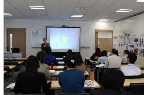
2018.01 Harvard Session